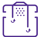
BACS À GRAISSES